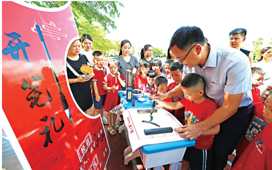
在老师的辅导下,一年级新生一撇一捺书写“人”字

击明志鼓,行盥洗礼,整理衣冠,书写“人”字……昨日,伴随着阵阵悠扬的古乐声,泉州市洛江区第三实验小学近400名一年级新生穿着新服,开笔明礼,感受古法礼仪的“启蒙”教育。