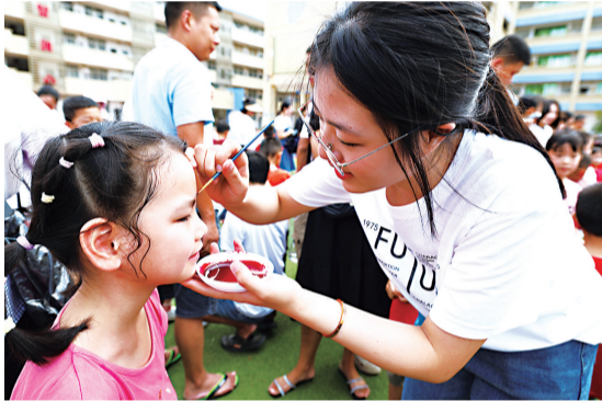
老师为一年级新生点朱砂,寓意开启智慧