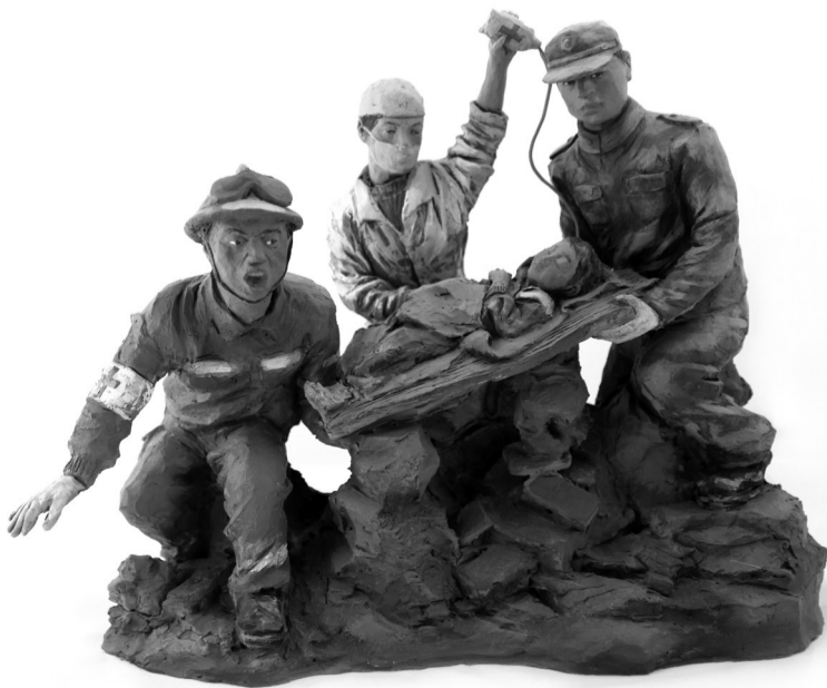
天津泥人张彩塑 赵阳作

那一刻,地裂山崩, 那一刻,动魄惊心; 与生命赛跑的节奏, 谱写了大爱中国和声! —清