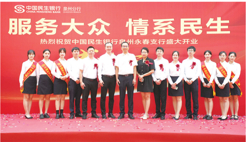
中国民生银行泉州永春支行团队合影