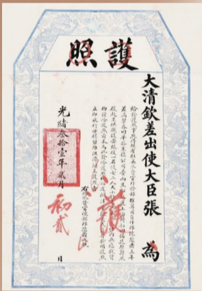
光绪三十一年(1905年)签发的护照