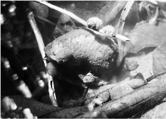
水中找到的福寿螺

福寿螺曾是不少吃货的至爱,后来多地发生食用福寿螺后发生寄生虫感染事件。专家实验发现,福寿螺体内寄生虫远高于其他螺类,未煮熟食用后,轻则发烧拉肚子,重则危及生命。