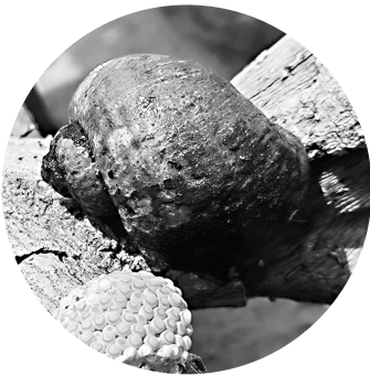
福寿螺附着在岸边