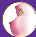
无痕痕水蜜桃丰胸