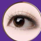
无痕灵动七度美眼