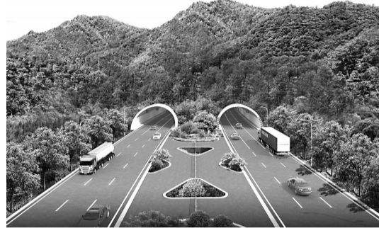
置了隔离带 南安段效果图,主线设

这条“高速公路”就是国道324改线工程,将与现有国道324线基本平行,承担大部分过境车流,缓解泉州中心城区、惠安城关和晋江磁灶、南安官桥、南安水头等镇区的交通压力。届时,现有国道324线将更名为省道209线。这也意味着,1936年全线修通的现有国道324线,在服务近90年后,圆满完成国道使命。