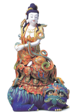
《极彩阿摩提观音》(连紫华)