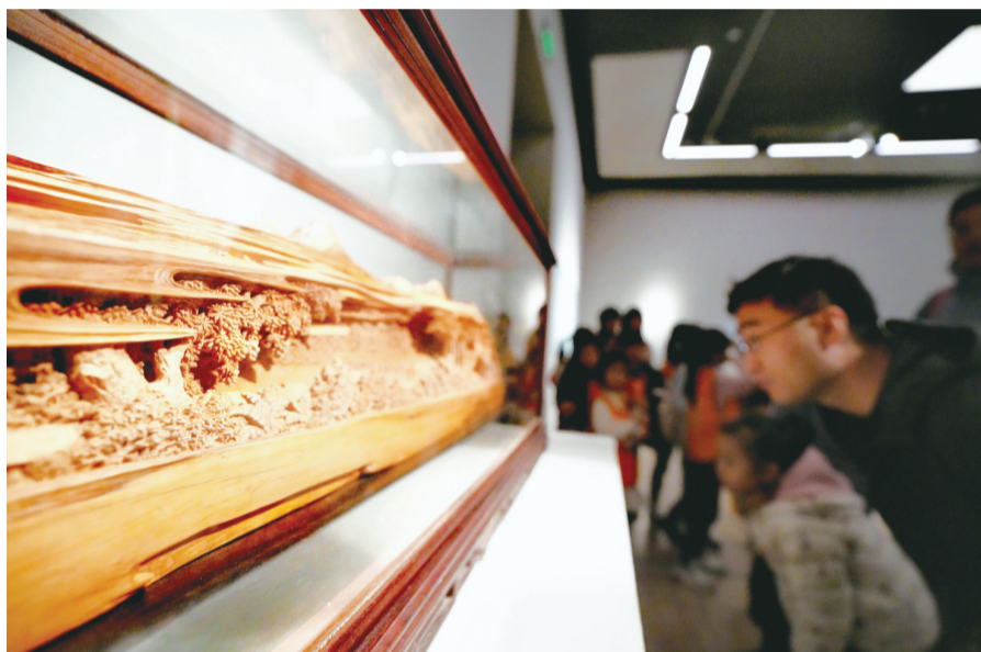
观众观看郑春辉的《故溪梦中流》

该展览集中展示了八闽工艺百花竞放、生机勃勃的繁荣景象,展现出福建工艺美术界“赓续历史文脉,谱写当代华章”的文化自信。民盟中央副主席、中国美术馆馆长、中国美术家协会副主席吴为山在致辞中表示:“艺术家用心、用情、用艺来创作出一件件非遗佳作。”