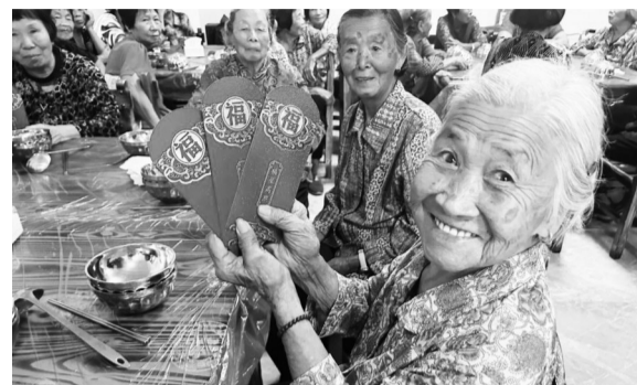
收到红包的老人很高兴

席里村积极向村民宣传移风易俗新风尚,将移风易俗婚丧简办写入村规民约,通过墙体标语、村村通大喇叭、移动宣传车等多种方式加大宣传力度。同时,充分发挥红白理事会的作用,坚决遏制婚丧嫁娶大操大办、高额彩礼等歪风陋习,推动乡风文明再上新台阶。