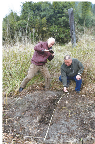
发现的宋碑6米开外的另一处石碑已失落(本版图片均来自建瓯融媒体中心)

刘珙年长朱熹8岁,其出仕后,亦多有提携举荐朱子,且大力助推朱子理学,如刘珙在担任漳州知州时,倡修岳麓书院,并促成朱熹与张栻在岳麓书院的会谈,留下朱张会讲的千古佳话。