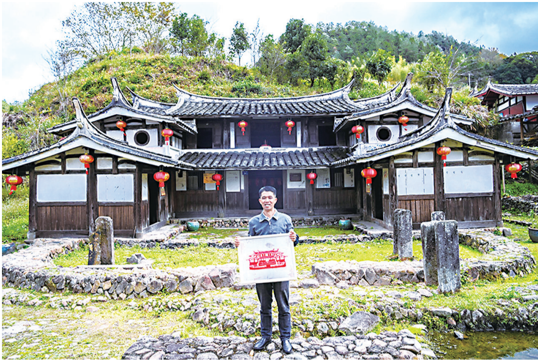
五百多年的宗祠与刻纸对比图