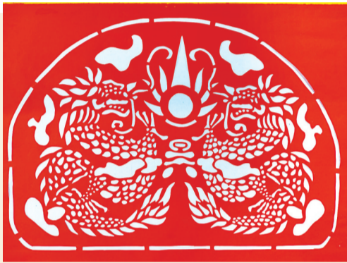
《双龙戏珠》 林长聪作品