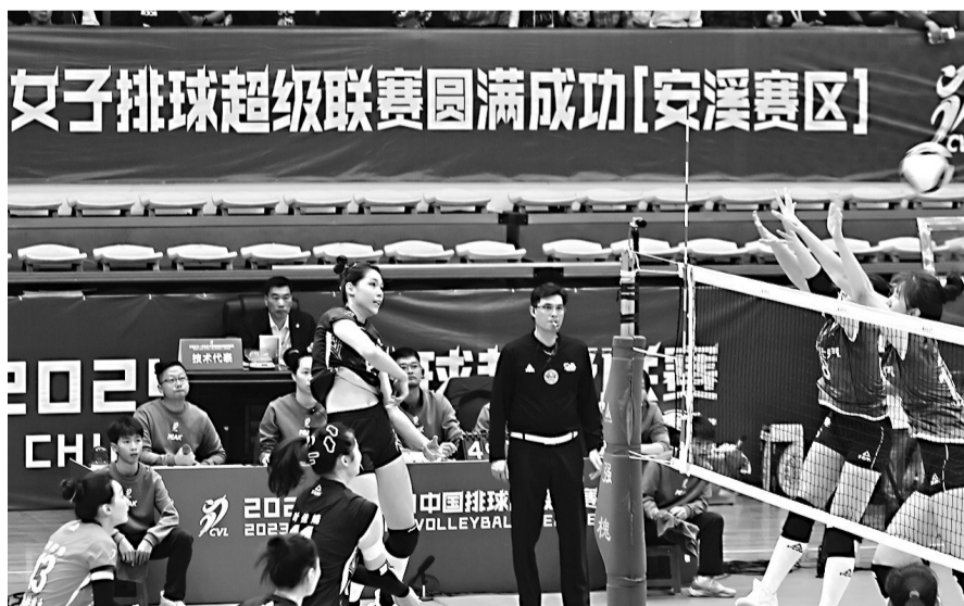
运动员在比赛中扣球

海都讯(记者 董加固 通讯员 许文辉 许艺燕 文/图) 12月2日下午3时30分,2023—2024中国女子排球超级联赛第一阶段第9轮第57场比赛在泉州安溪梧桐体育馆举行,东道主福建安溪铁观音女排主场迎战北京北汽女