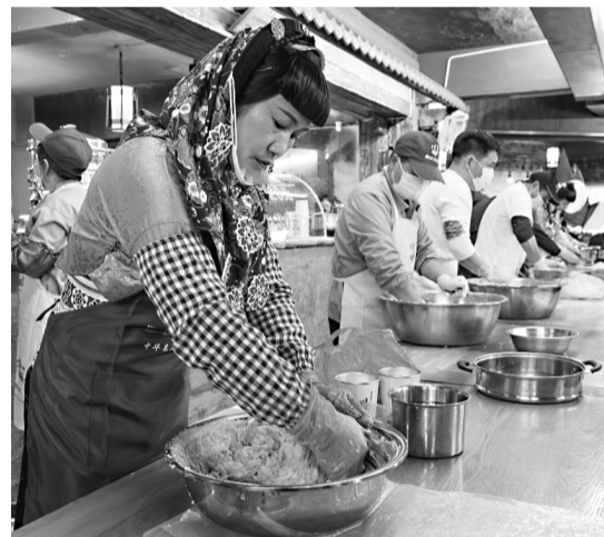
崇武阿姨正在制作鱼卷

据介绍,崇武鱼卷的来源与古时海防卫城——崇武古城有着密不可分的关系。据当地文史资料记载,明嘉靖年间,为了解决崇武城中军民粮食补给的不足和战备秩序问题,戍守士兵创造了易于储存和食用的鱼卷,以作干粮之用。在粮食缺乏,几乎没有冷冻设施、鱼贱米贵的