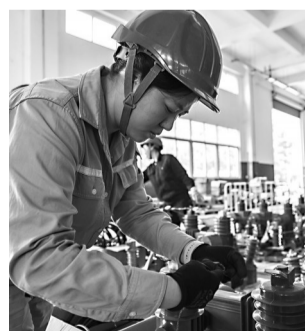
南安市供电公司在全省首创配电设备“工厂化”预制特色做法

司相关负责人介绍,目前工厂化预制工作已在高压引线电气预制、配网基础预制、配网设备调试预制等多个电气和土建施工场景开展,自主研发的“根开