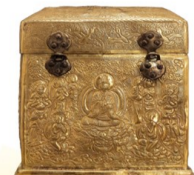
六臂观音纯金宝函

说到文物等级，咳咳咳！小秘，不可造次！我们可是此次来榕的三件“禁止出国（境）展览文物”！还曾装过佛祖舍利！