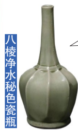
八棱净水秘色瓷瓶

盘兄，你虽贵比黄金，但我们也不差啊！乾隆皇帝遍寻不得的“千峰翠色”唐代秘色瓷便是在下！更何况，在今天琉璃也不算啥稀罕物件，做文物还是低调些好！不过讲真，你好歹算是“故地重游”，当年，你不正是从海上丝绸之路来到这里？也算是不枉此行啦！