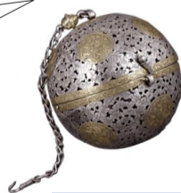
鎏金双蛾团花纹银香囊

是啊，“总是幻想海洋的尽头有另一个世界，总是以为勇敢的水手是真正的男儿……”我仿佛又看到了那片海，那艘船，还有那个水手！看到了那些香料源源不断从此上岸，从闽地到长安路途漫漫，实属不易啊。来此一趟，算是陆丝与海丝的丝丝相连！妙哉妙哉！