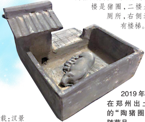
2019年,在郑州出土的“陶猪圈”随葬品