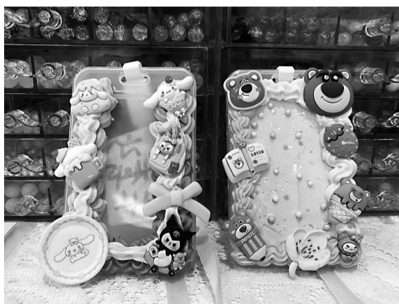
制作好的个性化校园卡

海都记者购买了一份奶油胶,打开挤出后,近距离能够闻到一股酸味。在产品的包装上印有注意事项:“不可食用,不可放入口中。如果不慎入眼,请用大量清水清洗,或到附近医院就医。14岁以下儿童请在家长陪同下使用,不适合3岁以下幼儿使用。”