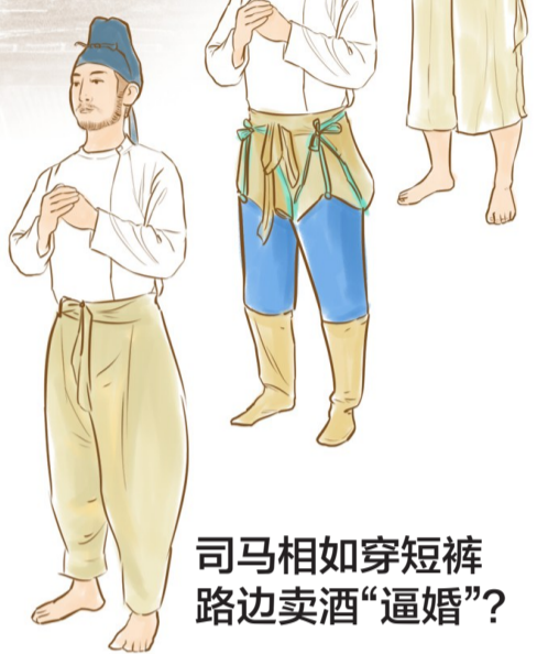
司马相如穿短裤 路边卖酒“逼婚”?

对于文人墨客和达官显贵来说,“犊鼻褌”显然是很草根的东西。不过,有时候有身份地位的人偶尔也会穿一下“犊鼻褌”,比如司马相如。