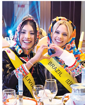
为现场观众送上祝福