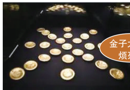
汉代海昏侯墓出土的部分金饼

古人素有窖藏黄金和随葬金银的风俗。位于南昌的海昏侯刘贺之墓,近日首次面向公众开放参观,刘贺主墓中就曾发现了大量的黄金。