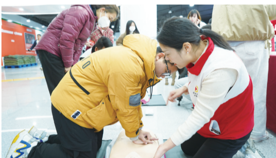
市民踊跃学习急救知识

海都讯(记者 林涓) 12月22日,福建省红十字会、福州市红十字会、福州地铁集团有限公司在福州地铁南门兜站举办“救在身边 贴心守护”福州地铁全线网设置自动体外除颤器(AED)启用仪式。