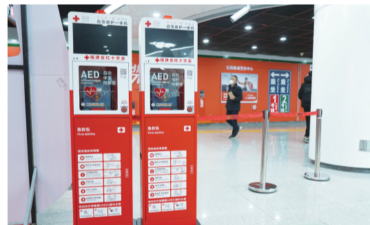
地铁内的自动体外除颤器