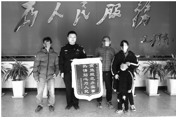
获救小孩家属向民警赠送锦旗

山路崎岖且地势复杂,加上天色渐晚,给搜救工作带来了极大的难度。为了尽快找到走失小孩,民警发动了附近的村民,兵分多路