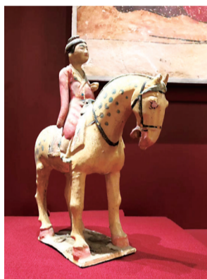
彩绘釉陶女骑马俑

“绝代风华——唐代女性生活展”今日在福州市林则徐纪念馆开展,以唐代女俑为主要展品,还有首次外出展览的唐昭陵仕女壁画