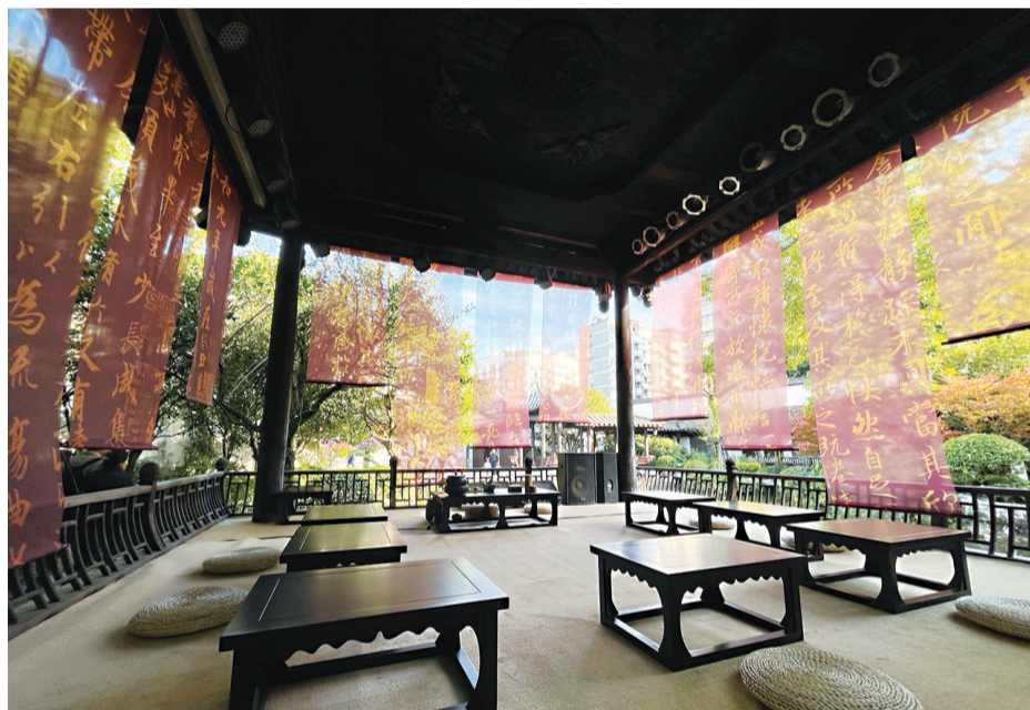
馆内临水戏台将为唐茶体验提供独特氛围

12月26日,“绝代风华——唐代女性生活展”在福州市林则徐纪念馆开展。这场文博展览置身福州“四大古厝”之一的林文忠公祠中,将展览至2024年5月5日。古朴幽深的古厝,搭配精美的唐代文物珍品,将为展览观众带来古韵悠长、身临其境的特别体验。