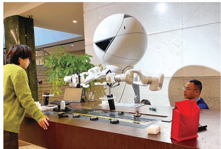
泡茶机器人“茶叶蛋”

而展厅外一款名为“茶叶蛋”的泡茶机器人也吸引着众人的目光,工作人员告诉记者,“茶叶蛋”为第三代机器人,第一代机器人“豹大白”曾在北京冬奥会亮相,以当代科技向四海来宾展示博大精深的中华茶文化。2号展厅完工后,更多精彩多媒体互动,也等待着观众来体验。