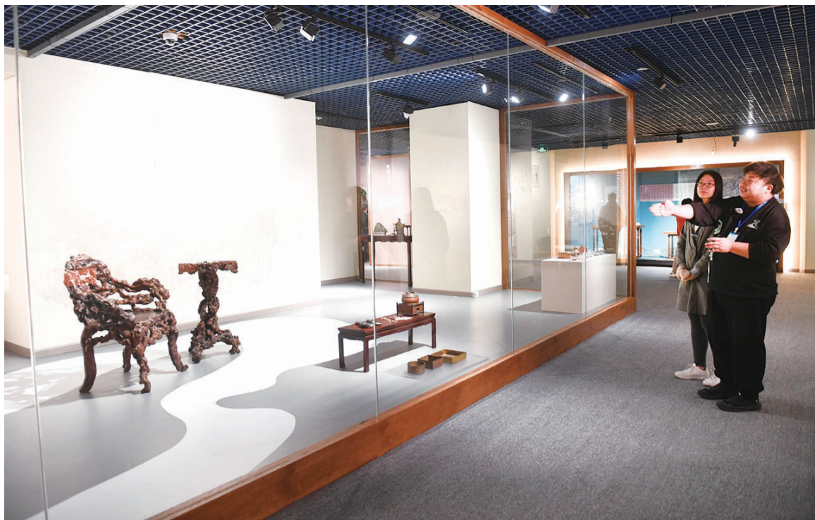
现场布置的乾隆“千尺雪”茶舍,充满了自然雅趣