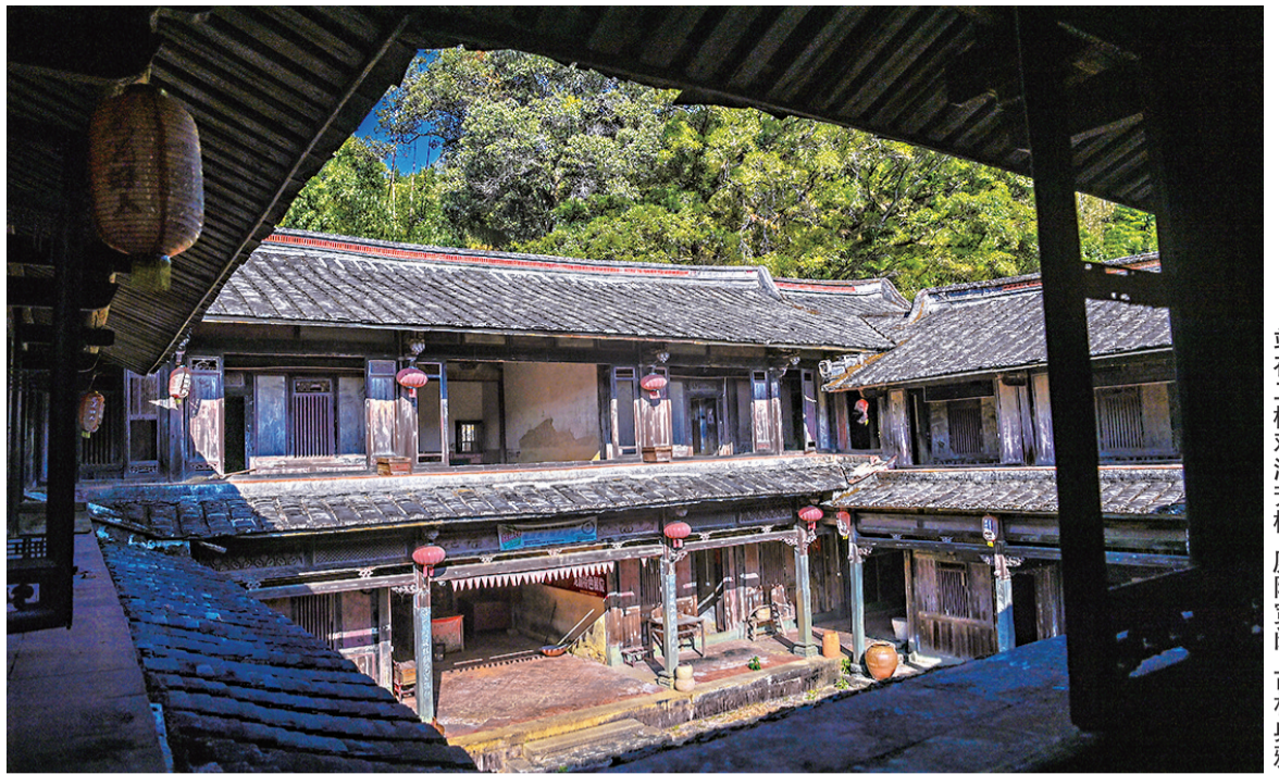
站在二楼观济芳楼,庭院宽阔、古朴典雅