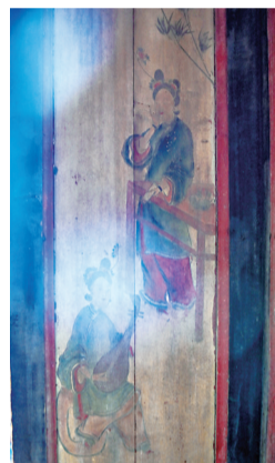
楼内的彩绘技艺精湛