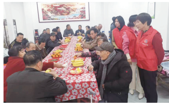
在叶厦村“农村幸福院”内，老人们欢聚一堂

不断有老年人前来体验“农村幸福院”，他们幸福的笑容中流露出对盖山镇党委政府的认可与肯定。叶厦村党支部有关负责人表示，将继续跟随上级党委政府的步伐，持续发挥党的基层堡垒作用，以民生温度检验主题教育成效，推动实现全体老年人享有基本养老服务，让老年人获得感、幸福感和安全感与日俱增，托起老年人养老“幸福梦”。