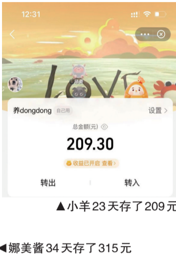
▲小羊23天存了209元 ▲娜美酱34天存了315元