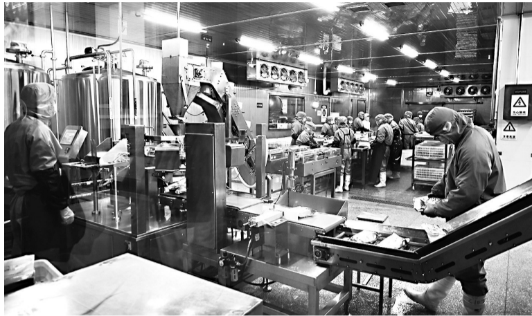
福州一民营企业预制菜自动化生产线

报告指出,2024年是全面贯彻党的二十大精神、深入实施“十四五”规划的关键之年。全市要紧扣“四个更大”重要要求,坚持稳中求进、以进促稳、先立后破,完整、准确、全面贯彻新发展理念,服务和融入新发展格局,统筹高质量发展和高水平安全,接续奋斗、砥砺前行,全方位推进高质量发展,加快建设现代化国际城市。