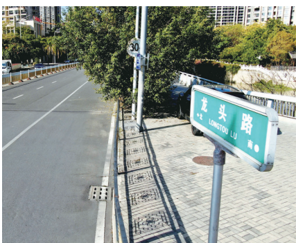
新店闽越古城遗址附近的龙头路