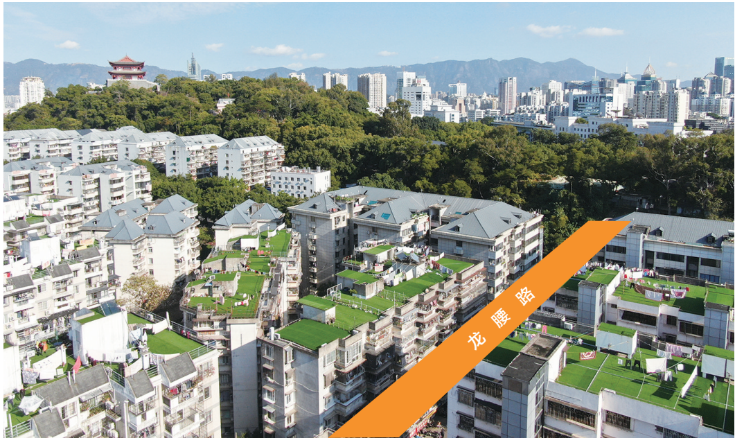
与镇海楼遥遥相对的龙腰路