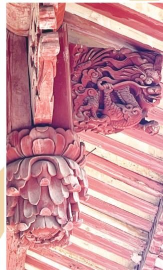
文庙的梁柱雕刻精美的龙纹