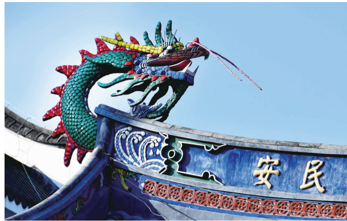
定光寺毗卢殿顶上的“龙”