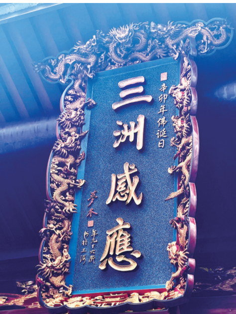
定光寺匾额上的“龙”