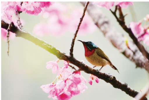
难敌红粉诱惑的叉尾太阳鸟

据了解,森林公园樱花园占地面积约2.5公顷,园内种植的樱花以福建山樱花及其改良品种为主,还有河津樱、松月樱等十余个不同樱花品种,它们的花期将持续到3月中旬。