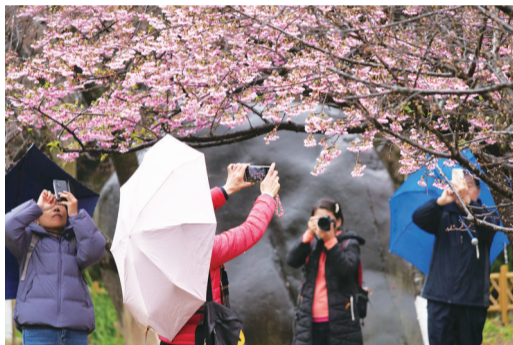
唯有手中的相机能带走这片红粉烂漫