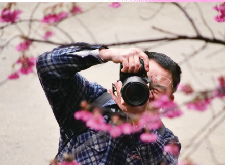
用镜头定格美好的瞬间