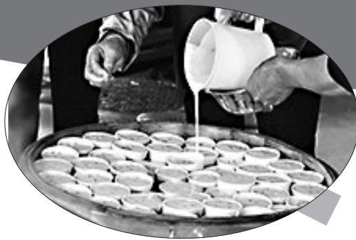
把发酵好的米浆倒入瓷碗