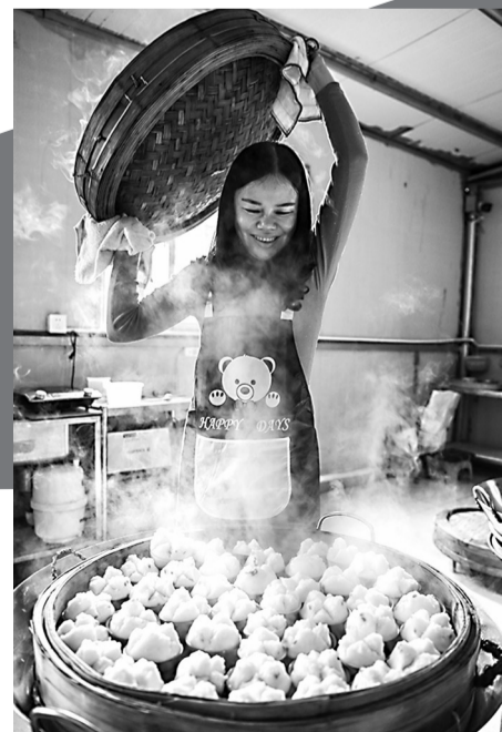
热腾腾的碗糕出炉