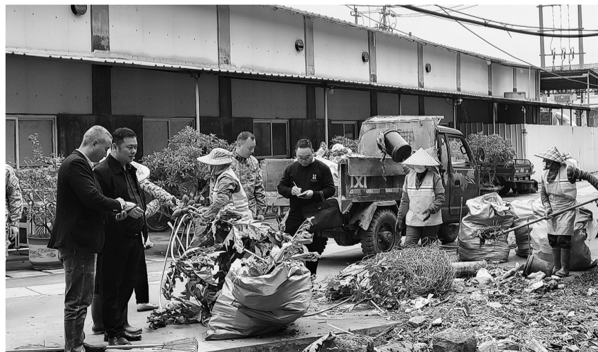
四都镇四都村的村两委正在组织环卫工人清理道路两边的垃圾

资5280万元在镇区实现了“应收尽收”,2023年完成雨污分离接管123户,动员67户自行开展雨污分离,建设化粪池134户。