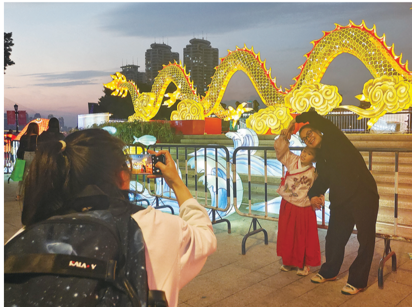
在福州仓前广场,市民和游客在“龙凤呈祥”灯组前开心拍照

表演时间:2月9日 20:00—00:24(20:00—00:00光影激光秀+MAPPING祝福,23:50—00:00无人机表演,00:00—00:24烟花无人机光影秀) 建议观看地点:茉莉大街、青年广场