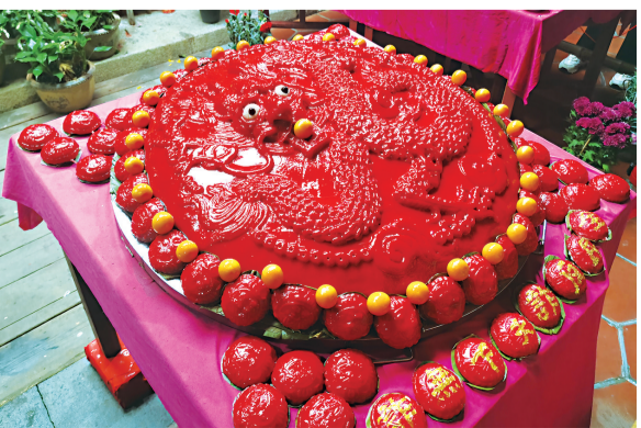
直径达88厘米的超大红团