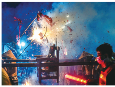
来年平安顺遂 用鞭炮炸神像,祈求