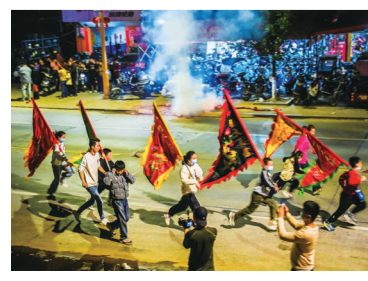
队伍的前头 孩子们拿着旗,走在