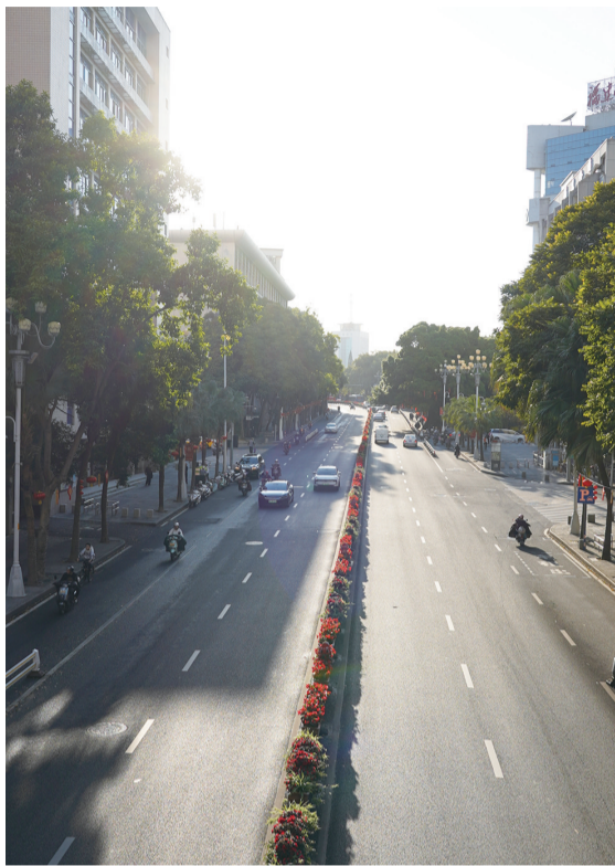
昨日傍晚,阳光照着福州华林路

降雨方面,21日夜里开始,福州部分乡镇出现阵雨或雷阵雨,22日降雨范围扩大,23—24日局部有小雨,大家外出要随身携带雨具。