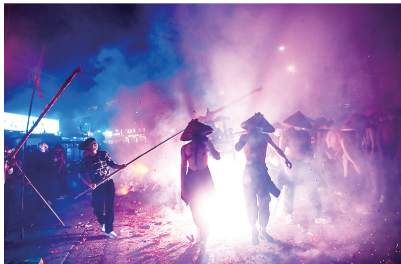
年轻人戴着斗笠赤膊上阵,在锣鼓喧天声中,抬着神像游行在大街小巷

20日是“逐火把”活动第一天,晚上七点左右,永春达埔的街道两边,家家户户都备好几十串长鞭炮挂在竹竿上,神像一抬过来,大家都拿着鞭炮往神像身上“炸”,一路上,烟花爆竹齐鸣。“最好能炸了天君的胡须,祈福消灾、添丁旺财最吉利。”有村民说道。