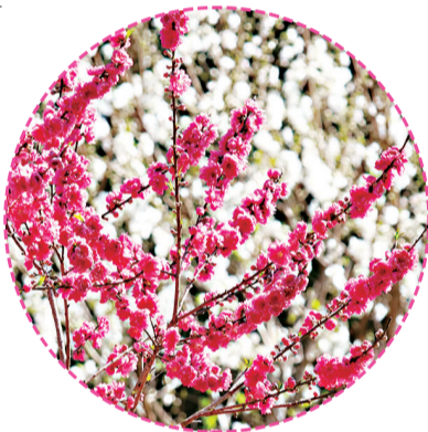
红色、白色桃花竞相绽放