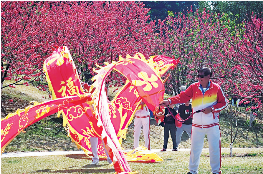
桃花树下，或拍照或娱乐，感受美好春光

不过，也有细心的市民发现，与福州国家森林公园相比，西湖公园和乌山上的桃花还未大面积绽放，只零零星星地盛开了一些。为何桃花花期不相同？对此，园林专家介绍，这主要与气温有关。福州国家森林公园位于福州北郊，受到城市热岛效应的影响，平均温度可能会比市区的公园低3℃至5℃。而更低的温度更有利于桃花的花芽分化。此外，品种也是另一个影响因素。