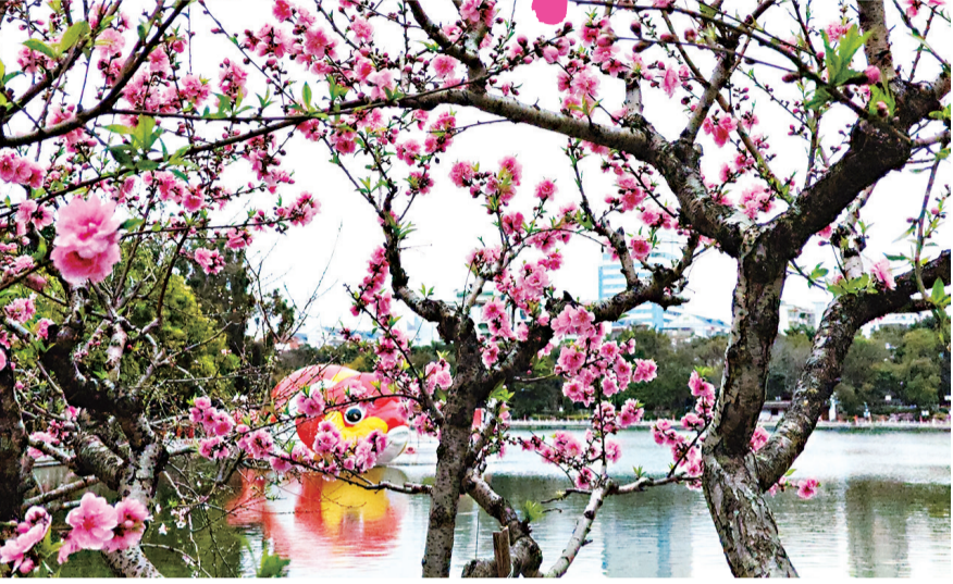
西湖公园柳堤的桃花陆续开放