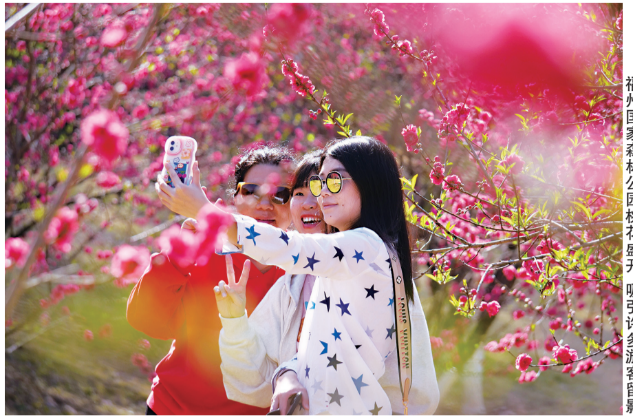
福州国家森林公园桃花盛开，吸引许多游客留影

最近天气越来越暖和，小粉花小白花开了不少，又给大家搞迷糊了。春天让人分不清的粉花、白花，大多数是桃、杏、梅、李、樱、海棠、梨这几类。下面就来教您识花。