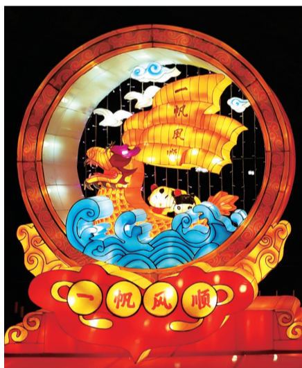
花灯凸显泉州民俗文化