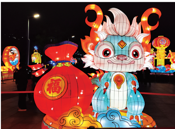
花灯体现“龙年”元素