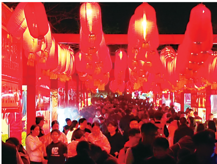
许多市民朋友前来打卡赏灯

“鲤城、丰泽、洛江、台商区的灯展各具特色,除了展出传统花灯,更多地凸显了泉州海丝、泉州民俗文化等元素,融合进现代的科技、时尚元素,传统的灯会焕发新活力。”该相关负责人表示。