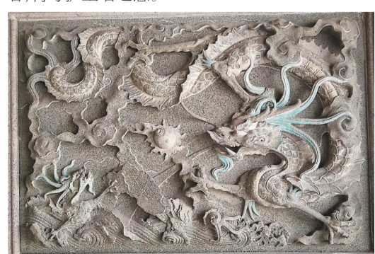
龙元素在闽台建筑中很常见

较为常见的龙形脊饰有“双龙抢珠”“双龙拜塔”“双龙拜三仙”等造型。如泉州天后宫和台北三峡祖师庙中有“双龙戏珠”脊饰,双龙面向一颗火焰腾腾、象征太阳的摩尼珠。而台中林氏大宗祠和台北大龙峒保安宫的屋顶则是“双龙拜塔”脊饰,双龙面向一个七层宝塔,有守护宝塔之意。