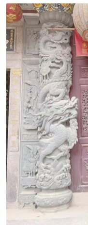
石狮城隍庙中的龙元素装饰和龙柱