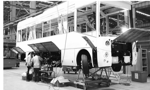
省重点项目威驰腾工 作人员在赶制海外订单

新年伊始,福建各地市也召开民营经济相关会议,共商良策、共谋发展。26日,记者从各地市政府工作报告和相关会议报道中,了解各地市在推动民营经济高质量发展方面的实招与亮点。