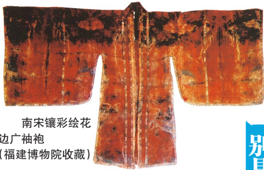
南宋镶彩绘花边广袖袍 (福建博物院收藏)