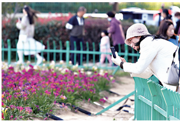
游客自觉在栏杆外拍摄

近花期正盛,游客很多,有些游客进入花圃里来回走动蹲下拍照,难免会“误伤”到小苍兰,请游客赏花时勿翻越栅栏进入花圃内。