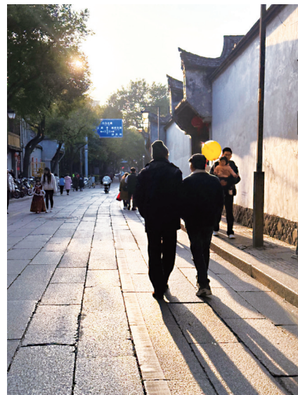
夕阳下,市民在三坊七巷游玩

海都讯(记者 罗丹凌 梁展豪 文/图) 春分不仅仅是一个节气,它更是一个新的开始,象征着希望与生机。在这个时节,让我们一起暂放下繁忙的工作,去感受春天的美好与温暖吧!正好21日福州天气不错,春游可以放心安排。而22—23日出现阵雨的可能性较大。