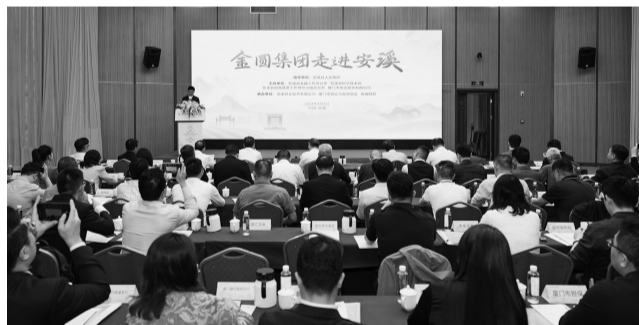
“金圆集团走进安溪”投资对接会现场

4月2日,厦门携一批优秀投资机构和企业走进泉州安溪,详细了解安溪产业发展情况,共话科技创新、共商资本赋能,茶乡绿水青山间,掀起“创投热潮”。