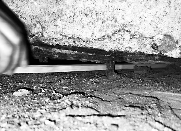
▲用棍子都能轻松穿透承重柱

除了承重柱之外,地下室还存在多处质量缺陷。混凝土墙、梁、柱、板构件多处存在钢筋外露,明显锈蚀;天花板存在多处裂缝,有的长达几