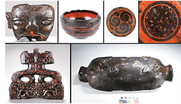
武王墩主墓室出土的部分漆器