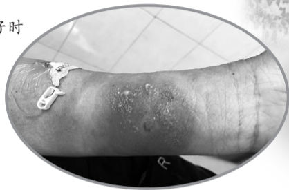
许阿姨全身多处皮肤大片皮疹、脓疱形成

人间最美四月天,正是踏青好时候,却也是各种虫子活跃的时候。泉州医生紧急提醒,在泉州部分地区如晋江、德化、洛江等地,红火蚁蜇伤人事件时有发生,严重的可致命。若不慎被蜇,症状较严重者应立即就近就医。