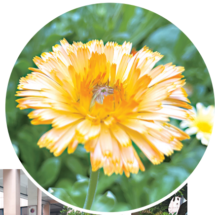
金盏菊迎春绽放,宛如校园里的一幅画卷

海都讯(记者 罗丹凌 实习生 林晓焮 文/图)用手触摸花朵的成长,用心感受世界的阳光。最近,福州市闽江公园管理处为福州市盲校师生种植的500平方米金盏菊开花了,让行动不便的全盲学生也有了接触花草的机会。