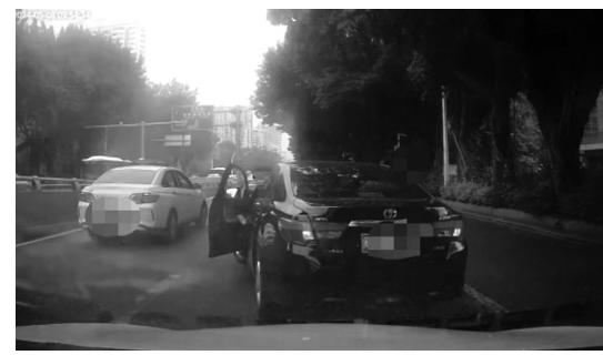
黑车超车后别停(视频截图)

称因礼让行人和非机动车遭别车，交警调查显示是因其未礼让在先引发误会，双方均有过错