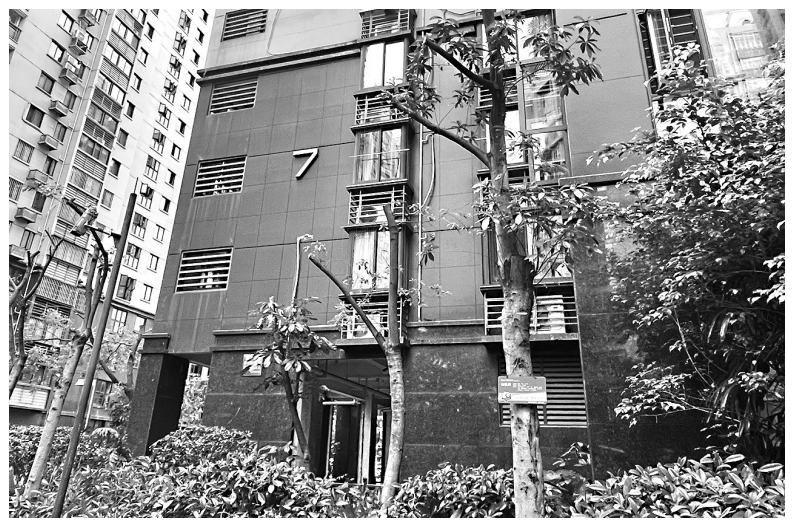
修剪后的小区绿化树

专家表示，通过图片观察，大部分树木保留了三级分枝，因此不影响树木的存活，后续树木能够继续生长，只是短时间内不太美观，林荫效果会差一点，不过，为了长远的安全考虑，树木适度的修剪是有必要的。