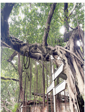
枯枝(画圈处)已发黑腐烂

接到报料后，记者赶到仓山区乐群路，一位正在清扫道路的保洁人员告诉记者，她的保洁工作从凌晨4点就开始了，在雨季确实有发现枯树枝掉在路面的情况。这里有些榕树都有年头了，每逢台风季，一些枯枝会掉下，但未曾发生过砸伤人员的情况。记者沿着乐群路慈院路口一路走访，在槐荫里4号前看到，一棵古榕树上的一处2米多长的枯枝已经发黑腐烂，在树上随风晃动。而在离碟园门口100米处的一棵古榕树(二级古树)上，一根枯枝横在树杈上，有2米长，直径有