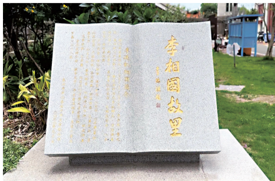
“李相国故里”纪念碑

近年来,泉州鲤城持续开展“世遗古城·文化楼栋”活动,结合各住宅小区属地历史底蕴、人文典故等,推动住宅小区英文字母、阿拉伯数字楼栋号加挂传统文化楼栋名,以此提炼展示地区文化精髓,彰显地域特色,浮桥街道百盛园便是其中之一。