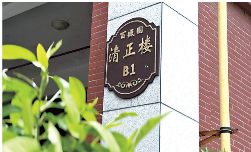
百盛园小区的清正楼