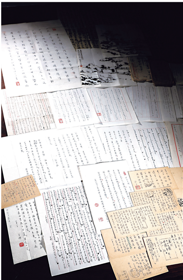
弘一法师墨迹组图

书写于“弘一体”成熟期的信札,从弘佛法、度众生、忧家国三方面,呈现真实的弘一法师形象