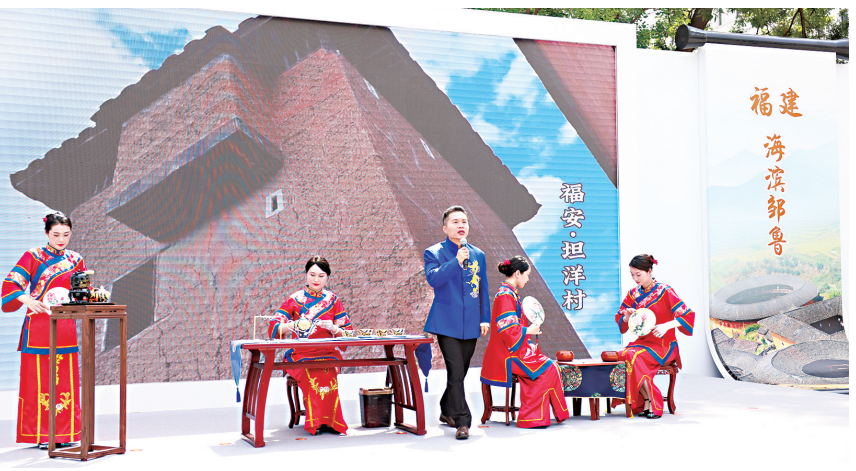
六月二日,两岸福茶坦洋工夫在北京展演