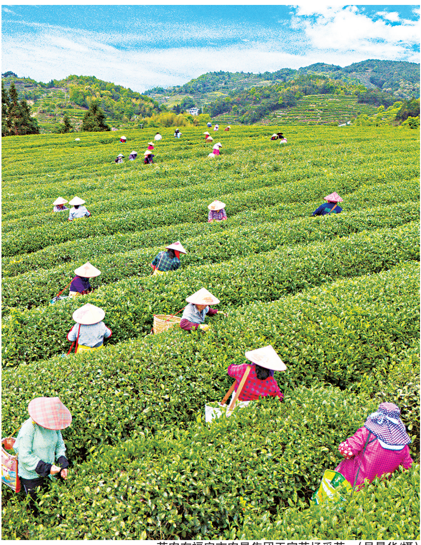
茶农在福安市农垦集团王家茶场采茶

栉风沐雨数十年,“一片叶子富了一方百姓”的实践在福安得到印证:去年,福安市毛茶产量2.81万吨,产值达22.5亿元,全产业链综合产值达120亿元,“坦洋工夫”品牌价值达51.72亿元,“坦洋工夫”获评“2023大众喜爱的中国茶品牌”。福安再次获评全国“2023年度重点产茶县域”“2023年度茶业高质量发展县域”。