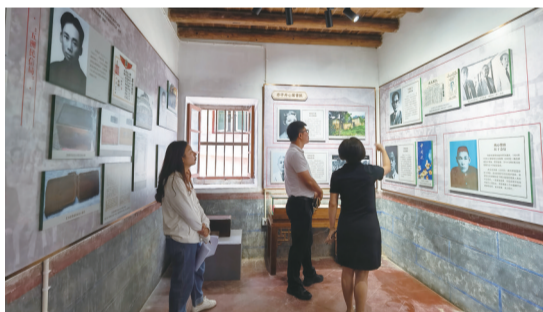
讲解员向海都记者介绍南安华侨的红色故事