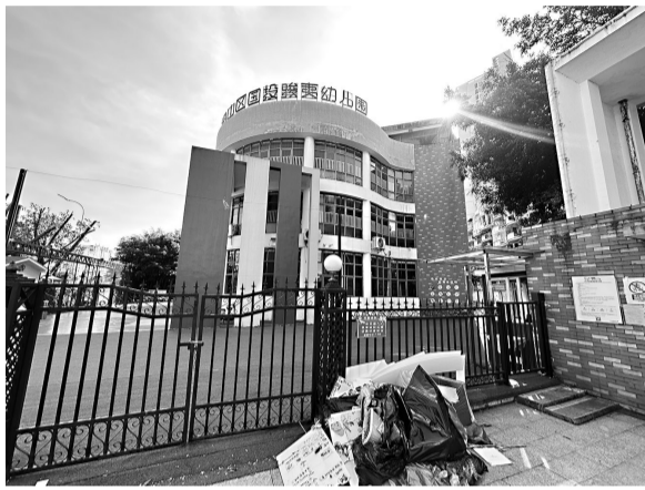
仓山区国投骏夷幼儿园

近日,有网友发文称“福州仓山区国投骏夷幼儿园倒闭”,引发热议。有网友表示:“前几天还看到招生公告,今天却突然闭园了。”记者向仓山区教育局了解到,该幼儿园并非“倒闭”,而是暂停招生,复园时间要视实际情况而定。