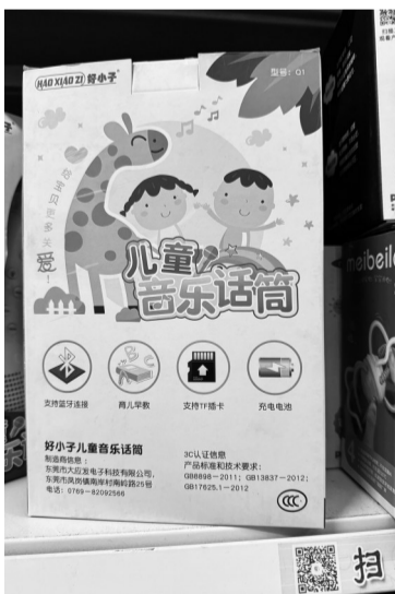
工粗糙且没有合格证 一家玩具批发商店内的「声光电」玩具做

记者在各大直播平台看到,“声光电”玩具的定价在10元到50元不等,尽管商家以“7天无理由退换”等关键词进行宣传,但对于玩具的安全认证问题却较少提及。